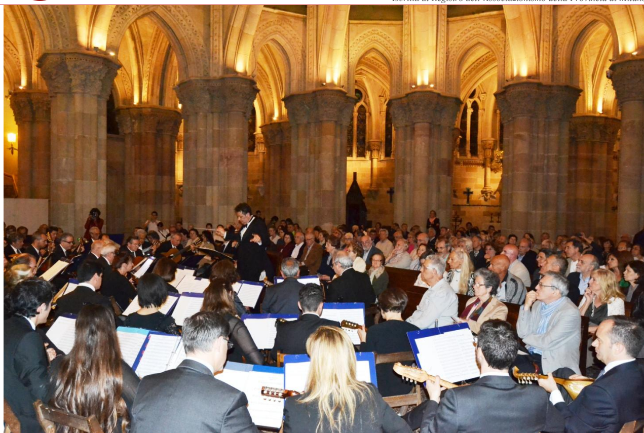
“Cripta de la Basilica de la Sagrada Familia- Barcellona Maggio 2014”

Iscritta al Registro dell'Associazione della Provincia di Milano