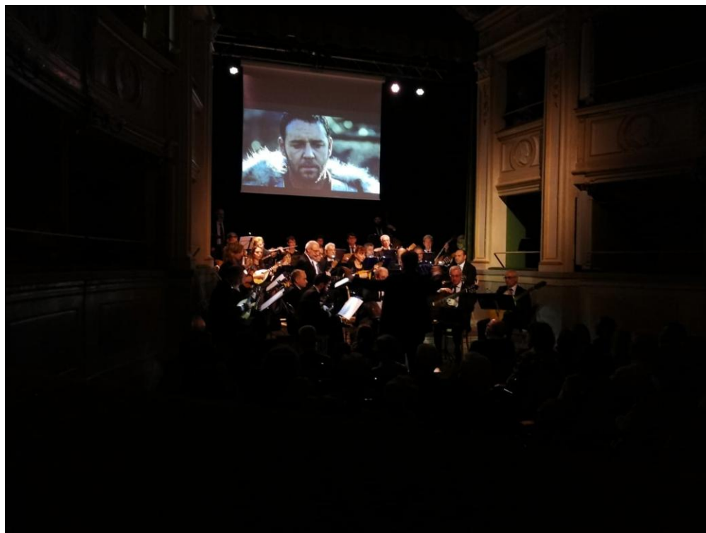
”Teatro Gerolamo - Aprile 2018”

Iscritta al Registro dell'Associazione della Provincia di Milano