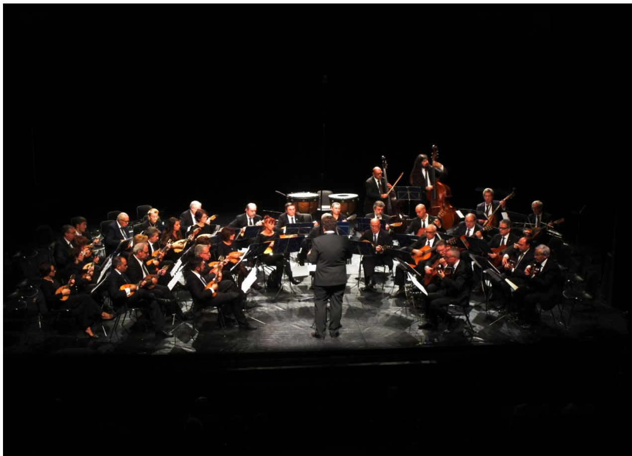
“Mandolini a Milano Ottobre 2015- Teatro dell’Arte – Triennale Milano”

Orchestra a plettro Città di Milano, via Bezzacca, 24 – 20135 Milano