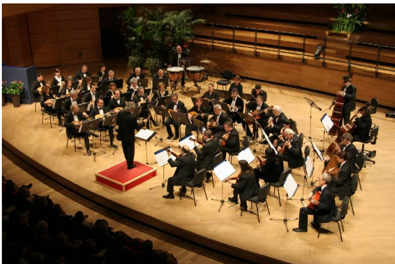
L'Orchestra al Teatro Dal Verme di Milano, per l'anniversario 2006 del Touring Club Italiano

Orchestra a plettro Città di Milano, via Bezzacca, 24 – 20135 Milano