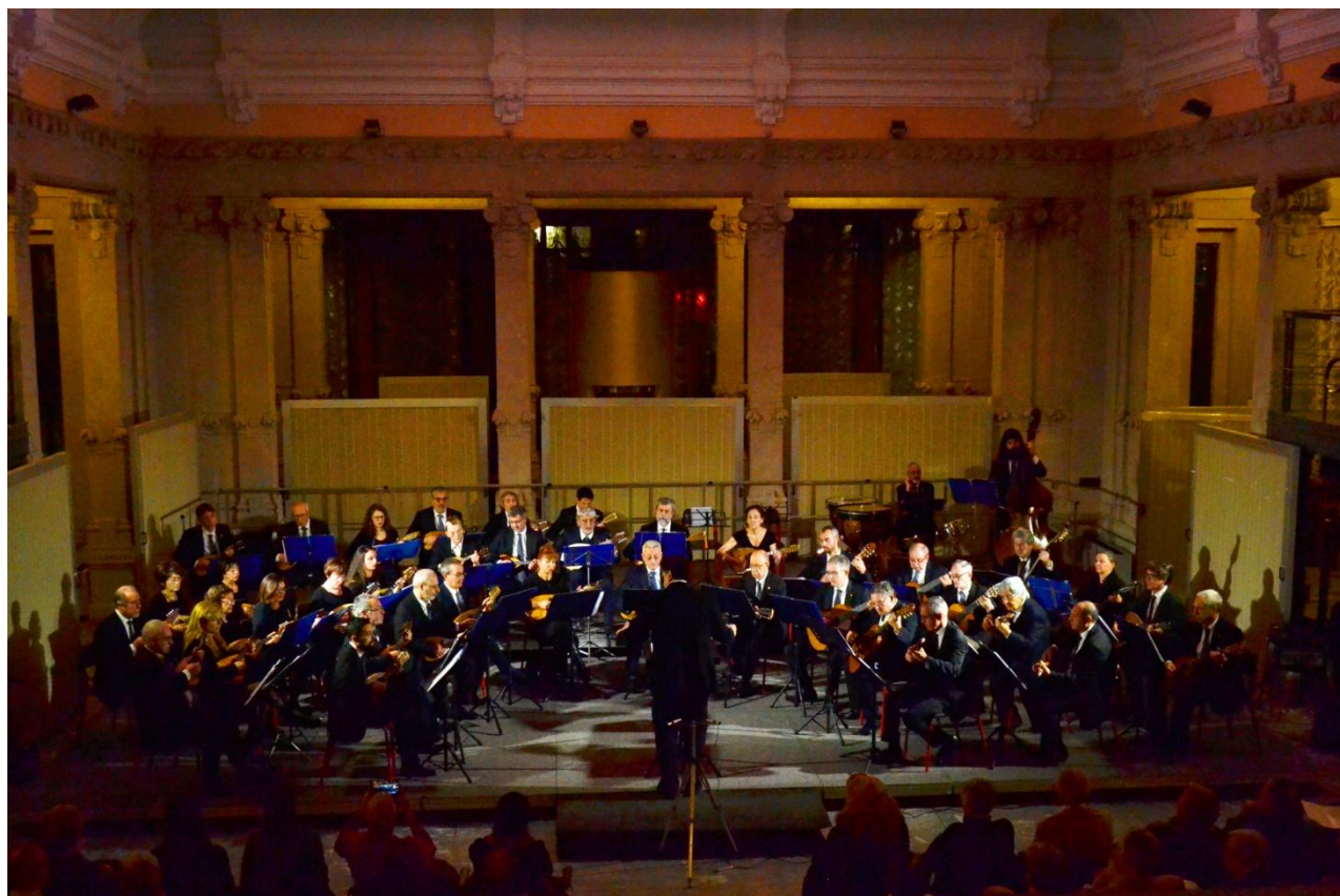
”Palazzina Liberty - Dicembre 2017”