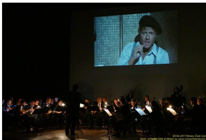
“Teatro Cagnoni –Vigevano (Pv) - Aprile 2017