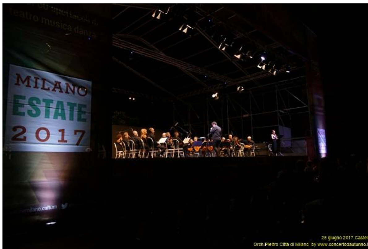
“Estate Sforzesca- Castello Sforzesco –Milano - Giugno 2017”