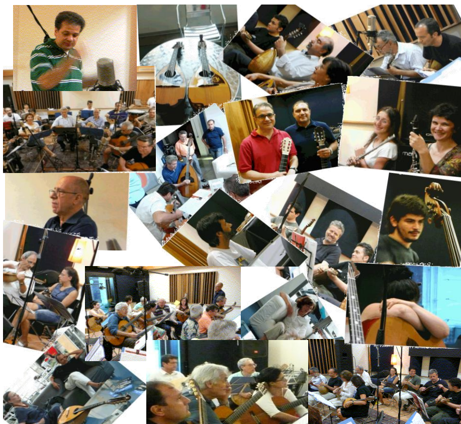
La registrazione dell'ultimo CD nel 2010

Iscritta al Registro dell'Associazione della Provincia di Milano