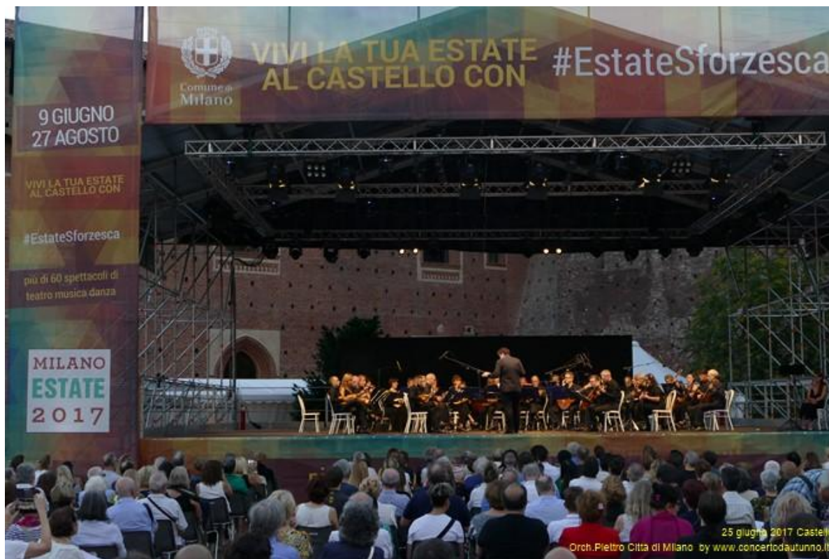
“Estate Sforzesca- Castello Sforzesco –Milano - Giugno 2017”

Iscritta al Registro dell'Associazione della Provincia di Milano