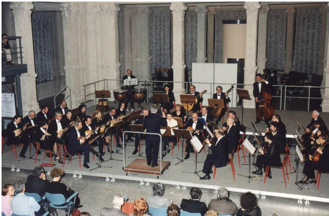
L'Orchestra alla Palazzina Liberty di Milano

Iscritta al Registro dell'Associazione della Provincia di Milano