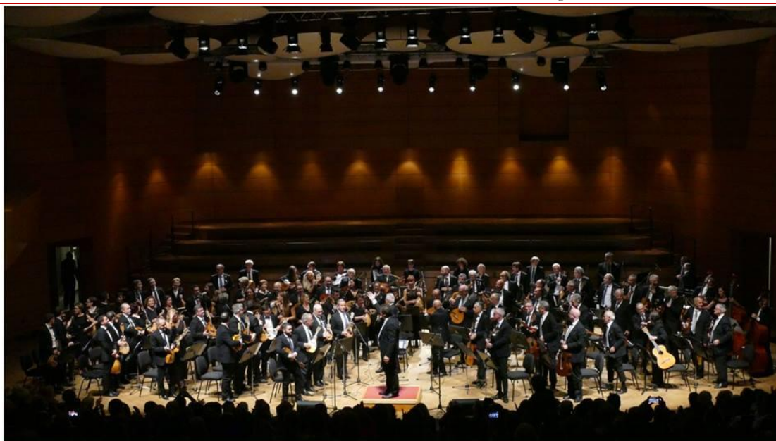
“Mandolini a Milano - 2° Festival Internazionale Orchestre a plettro” Orchestre Riunite Teatro Dal verme Milano - Ottobre 2018

Iscritta al Registro dell'Associazione della Provincia di Milano