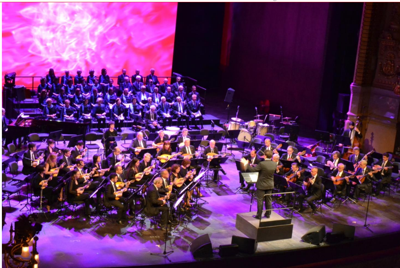
”Gran Teatro del Liceu- Barcellona – Giugno 2014”

Iscritta al Registro dell'Associazione della Provincia di Milano