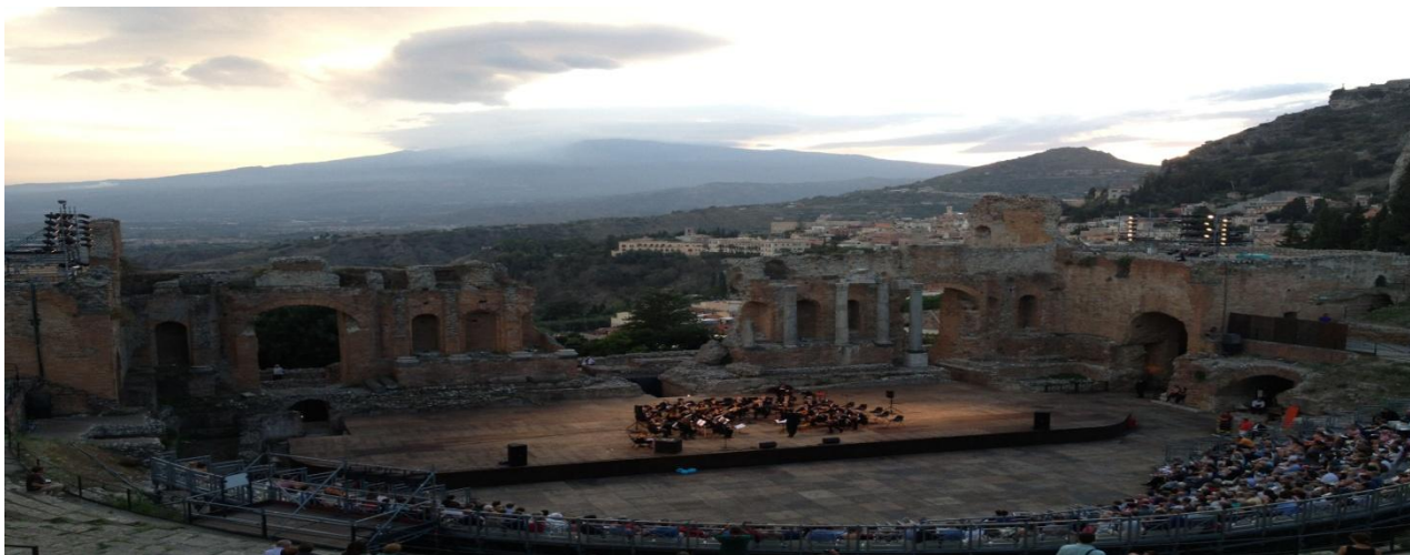
“Festival Internazionale delle Orchestre a plettro –Taormina -Teatro Greco Settembre 2013”