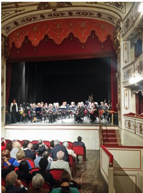
“Teatro Giuseppe Verdi- Busseto (PR) Maggio 2016”