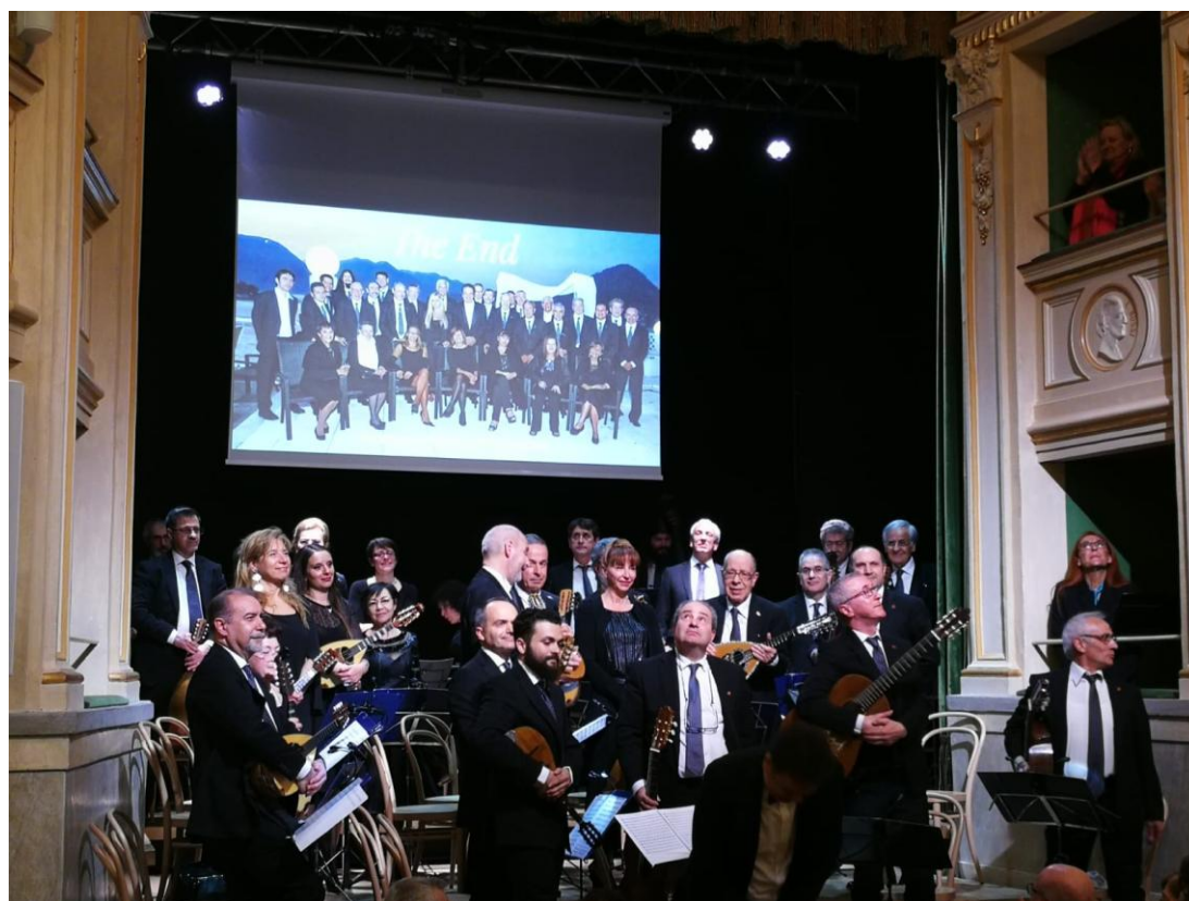
”Teatro Gerolamo - Aprile 2018”