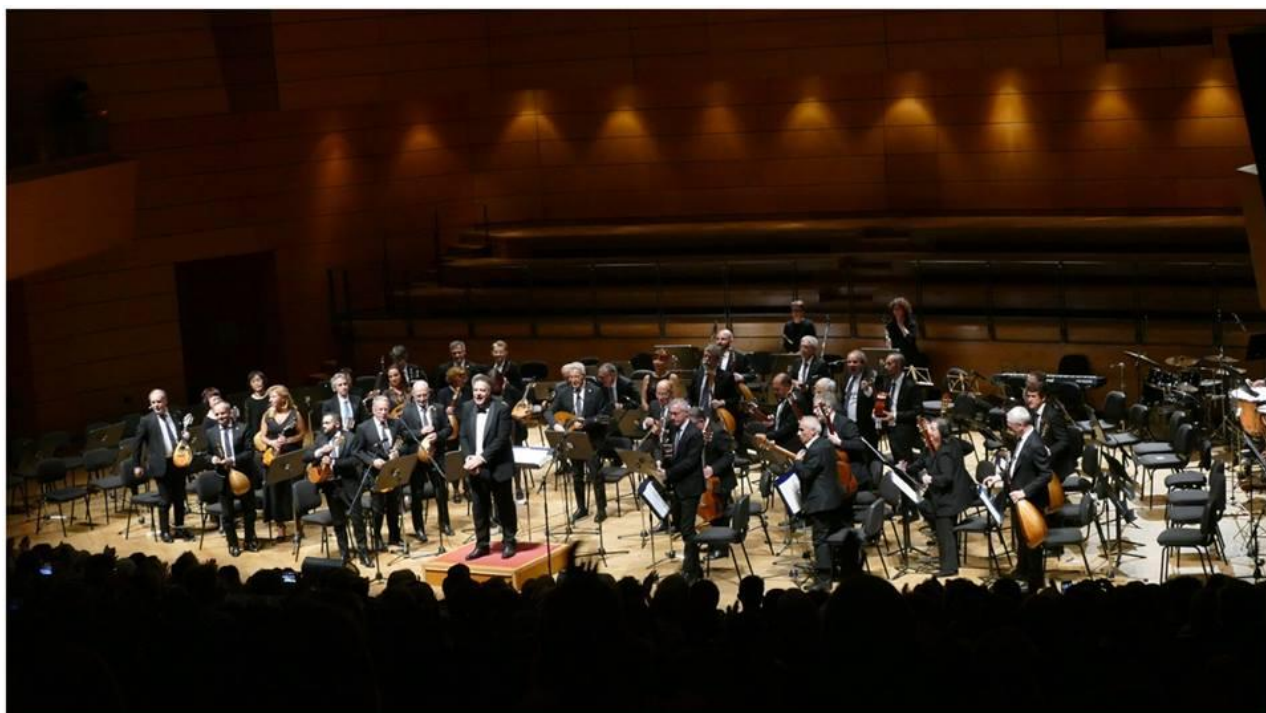
“Mandolini a Milano - 2° Festival Internazionale Orchestre a plettro” Teatro Dal verme Milano - Ottobre 2018

Orchestra a plettro Città di Milano, via Bezzacca, 24 – 20135 Milano