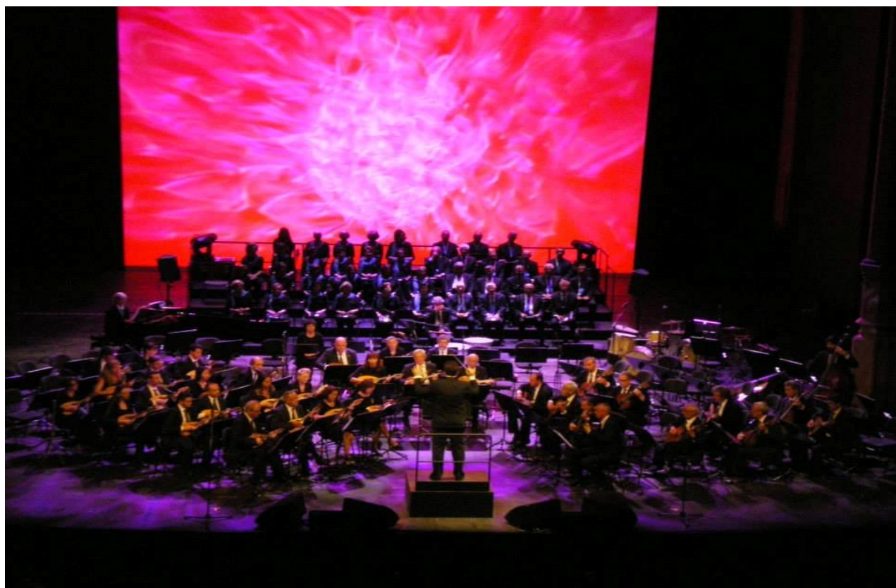
“Gran Teatro del Liceu- Barcellona – Giugno 2014”

Orchestra a plettro Città di Milano, via Bezzacca, 24 – 20135 Milano