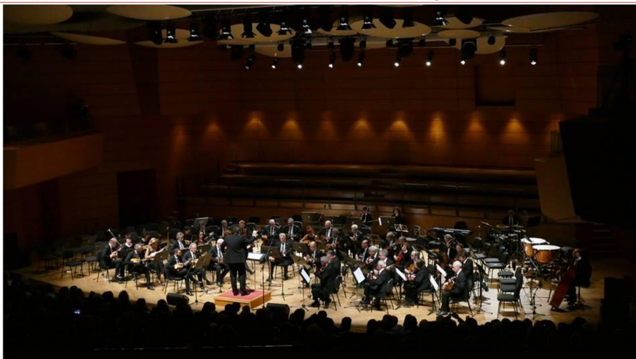
“Mandolini a Milano - 2° Festival Internazionale Orchestre a plettro” Teatro Dal verme Milano - Ottobre 2018

Iscritta al Registro dell'Associazione della Provincia di Milano