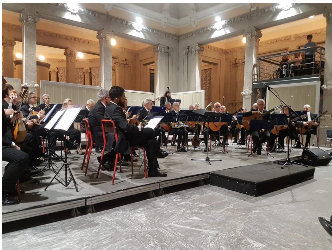
”Palazzina Liberty - Dicembre 2018”