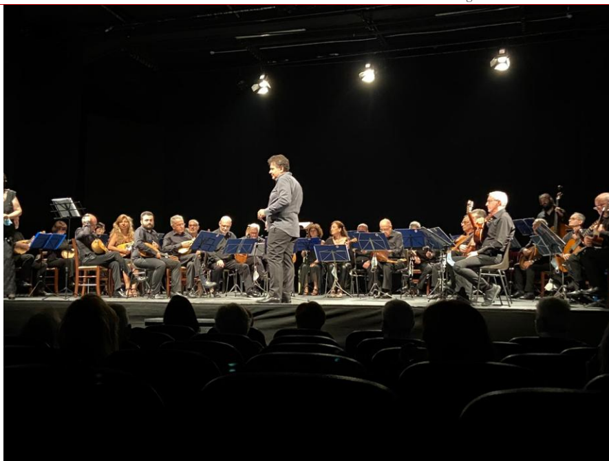
Teatro Menotti Luglio 2021

Iscritta al Registro dell'Associazione della Provincia di Milano