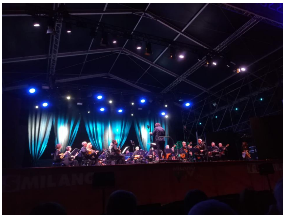
”Milano Viva Estate Sforzesca 2022”