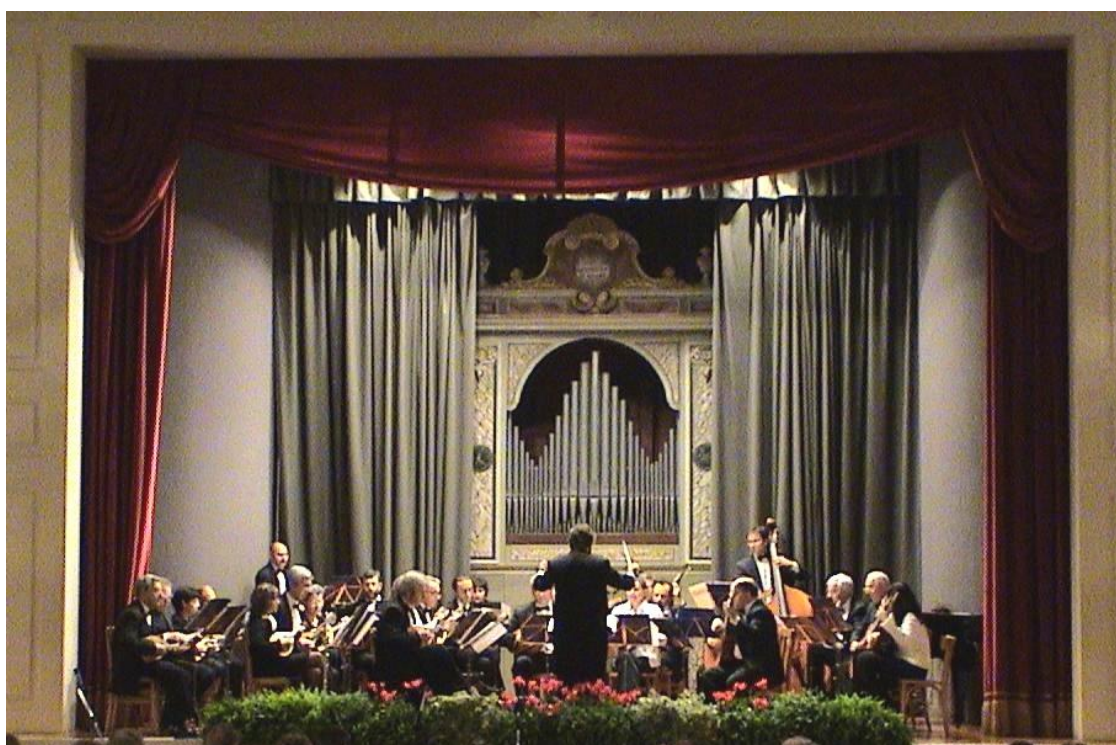
A Vittorio Veneto per il convegno 2004 della Federazione Mandolinistica Italiana

L'Orchestra è associata alla Federazione Mandolinistica Italiana , è affiliata al CRAL del Comune di Milano ed è iscritta al Registro dell'Associazione della Provincia di Milano .