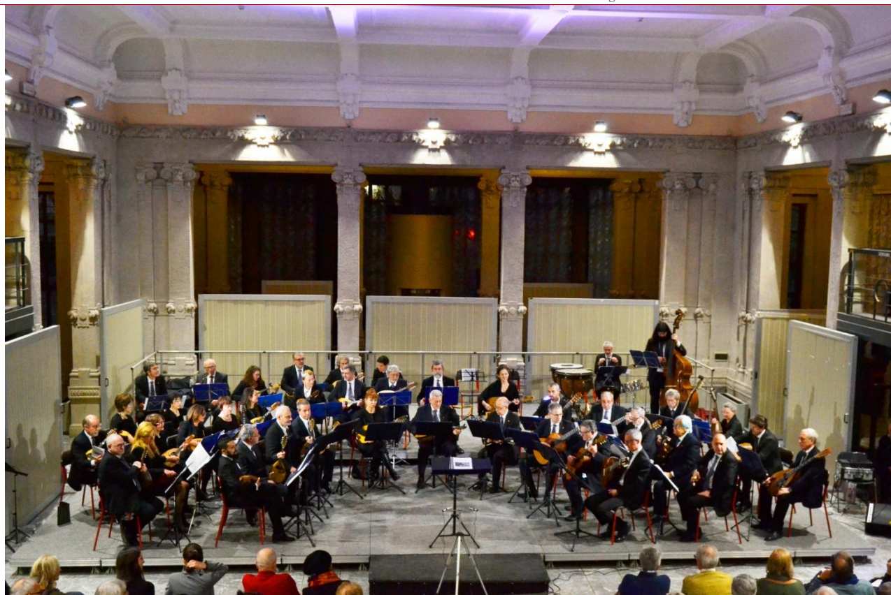
”Palazzina Liberty - Dicembre 2017”

Iscritta al Registro dell'Associazione della Provincia di Milano