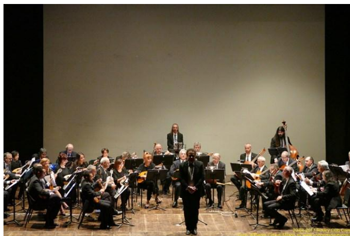
“Teatro Cagnoni –Vigevano (Pv) - Aprile 2017