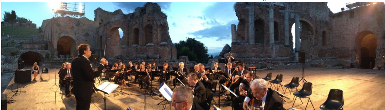
“Festival Internazionale delle Orchestre a plettro –Taormina -Teatro Greco Settembre 2013”

Iscritta al Registro dell'Associazione della Provincia di Milano