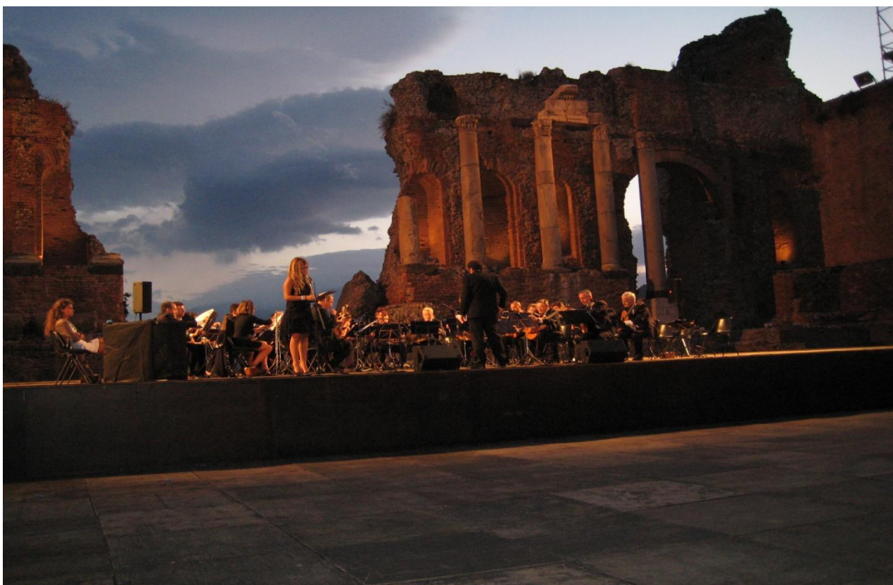
“Festival Internazionale delle Orchestre a plettro –Taormina -Teatro Greco Settembre 2013”

Orchestra a plettro Città di Milano, via Bezzecca, 24 – 20135 Milano