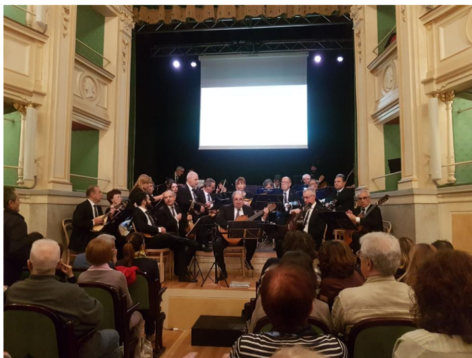
”Teatro Gerolamo - Aprile 2018”

Orchestra a plettro Città di Milano, via Bezzacca, 24 – 20135 Milano