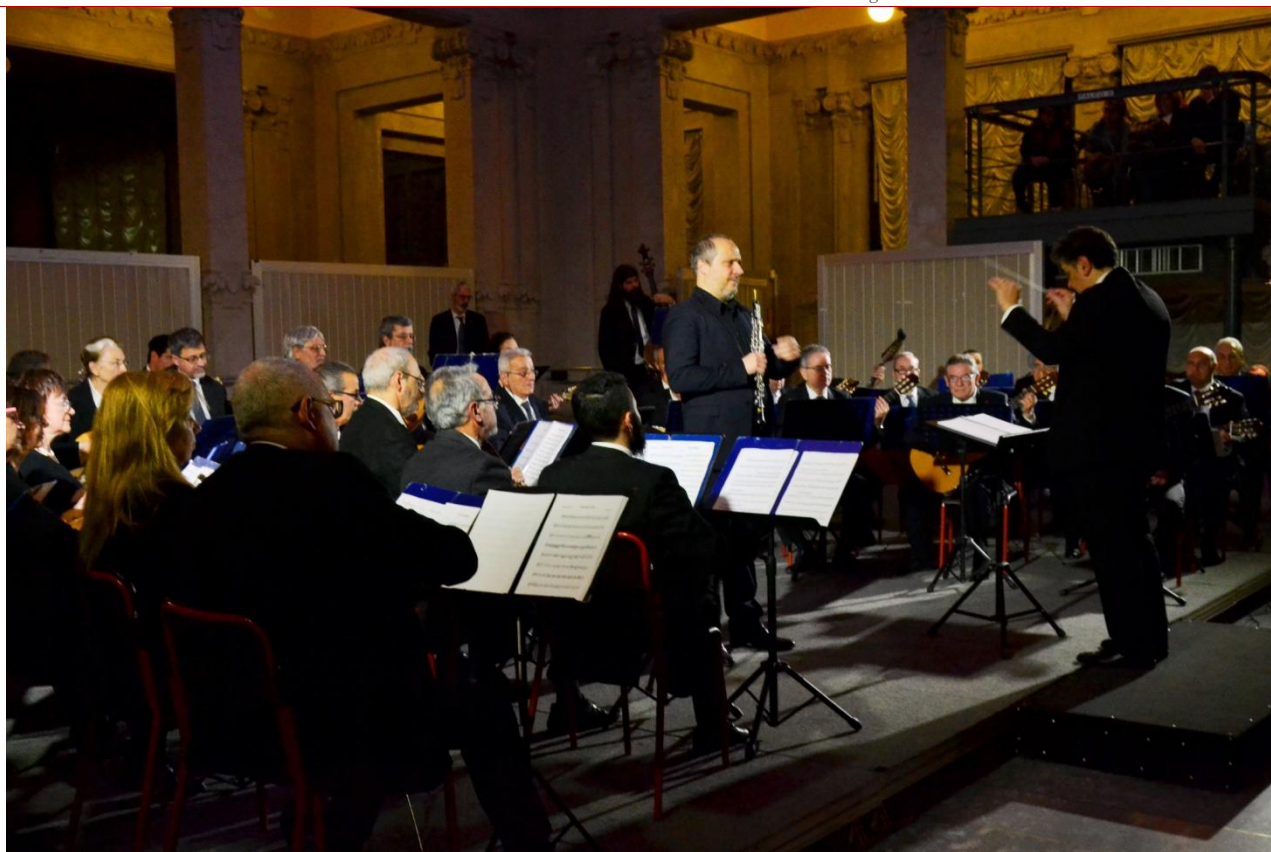
”Palazzina Liberty - Dicembre 2017”

Iscritta al Registro dell'Associazione della Provincia di Milano