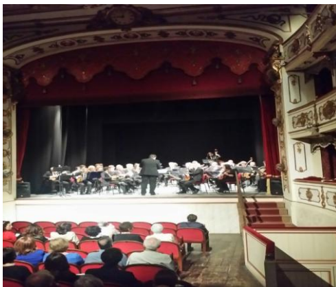
“Teatro Giuseppe Verdi- Busseto (PR) Maggio 2016”

Iscritta al Registro dell'Associazione della Provincia di Milano