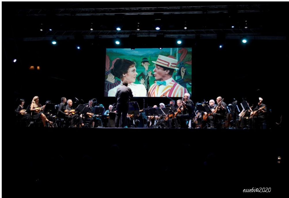
“Teatro Gerolamo Marzo 2019”